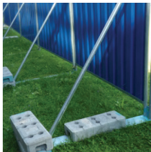
Bodenplatte + Verstrebung