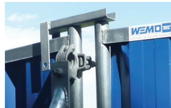
Drehgelenk, zum Bau von Türen und Tore